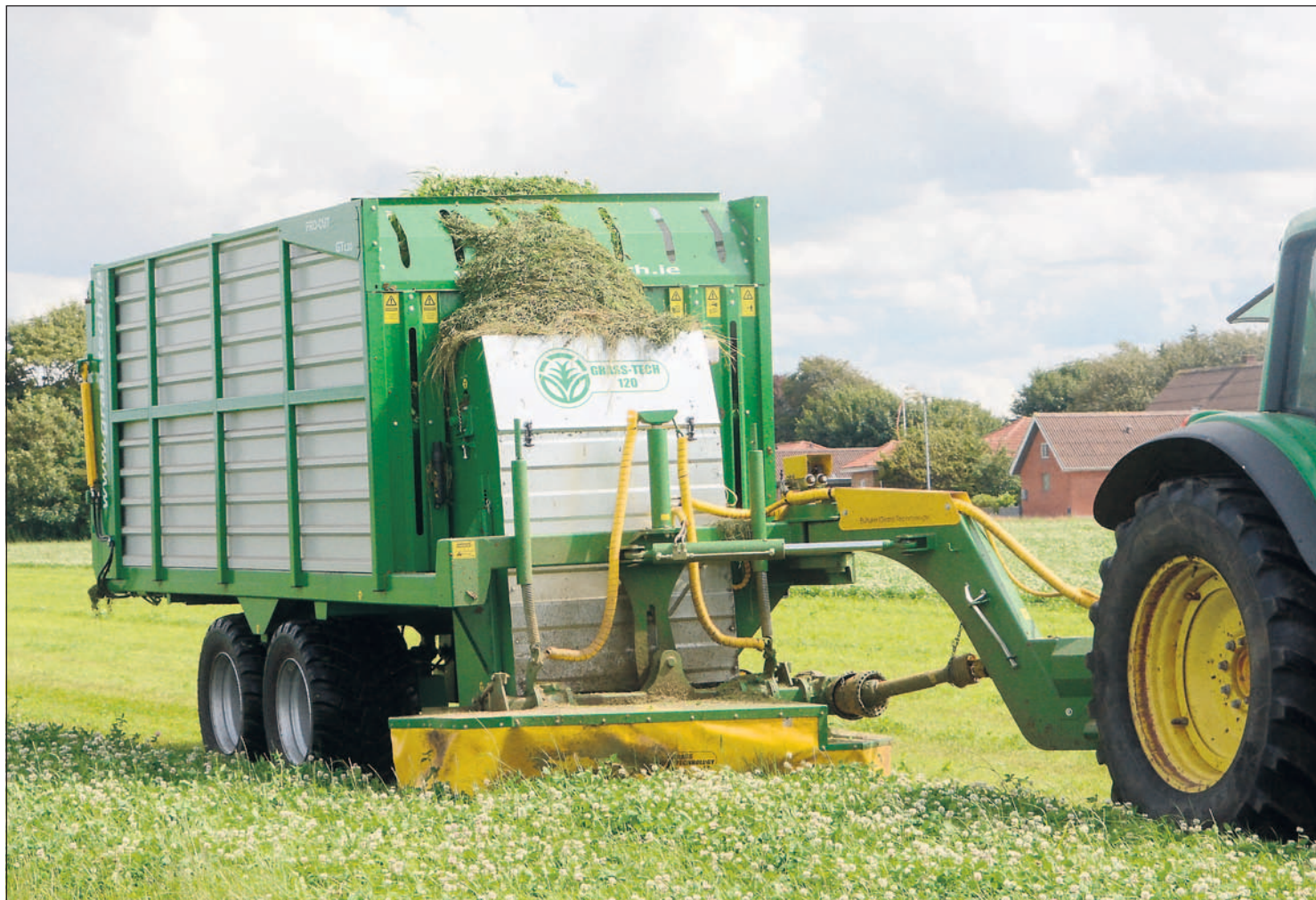
Det græs, der høstes med tromleskårlæggeren og vogne sideforskudt ud i arbejdsstilling, svarer ca. til græs i en fem-slæt-strategi.